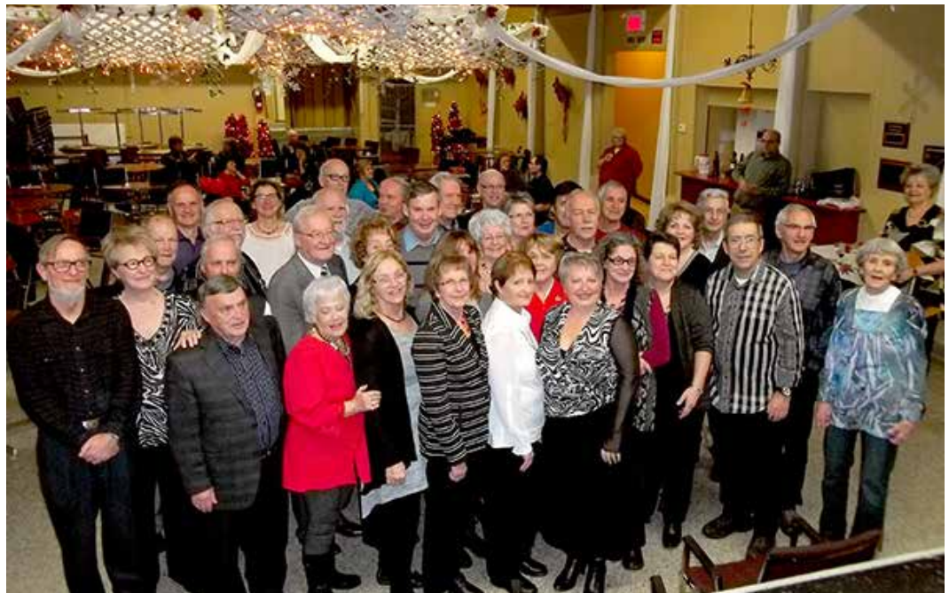
Le Cantonnier a fêté ses bénévoles !

Le journal Le Cantonnier entame sa 15 e année