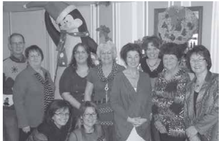
Les membres du conseil d'administration du journal.

En janvier 1998, le journal est pris en main par la Corporation locale de développement de Lac-Bouchette (CDLB).