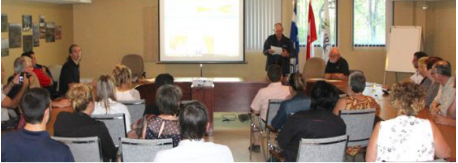
Plus d'une trentaine de personnes ont constaté les possibilités du nouveau site web du journal lors de son récent lancement