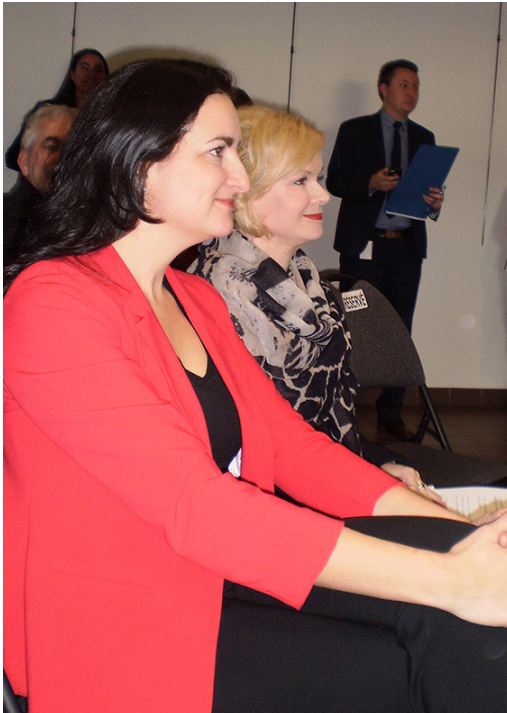
Bas de vignette : à gauche, Marie Montpetit, ministre de la Culture et des Communications; à droite, Julie Boulet, ministre du Tourisme lors de l'annonce d'une aide financière pour soutenir la presse d'information.

La ministre de la Culture et des Communications, Marie Montpetit, a annoncé le 4 décembre en conférence de presse à Trois-Rivières, un soutien accru aux médias communautaires s'élevant à 5,2 M $ sur une période de cinq ans. Les médias communautaires devraient recevoir sous peu une lettre d'annonce à cet effet.